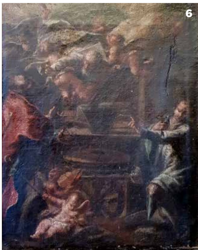
1. Giuseppe Bottani Sacra famiglia con San Giovanni 2. Giuseppe Bottani Sacra famiglia con San Giovanni , particolare della scritta al retro esaltata in falso colore 3. Giuseppe Bottani San Pietro 4. Giuseppe Bottani San Paolo 5. Giuseppe Bazzani, Ritratto femminile 6. Siro Baroni, Mulino mistico

In particolar modo il riferimento è alla pala d'altare raffigurante un Mulino mistico (soggetto, in questo specifico caso, più adeguato di quello tradizionalmente ricordato di “Torchio mistico”, tema peraltro più volte approfondito da Angelo Loda) conservata in Sant'Orsola a Mantova.