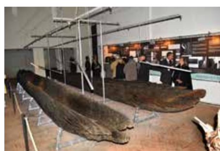
Sopra, esemplare di ambra con un insetto incastonato e i resti di una piroga sulla riva dell'Oglio, a Volongo; a sinistra, tracce di palafitte nello stesso fiume. Qui a fianco, a sinistra la piroga conservata al Museo Rambotti di Desenzano; a destra, la sala delle piroghe del Museo Archeologico di Ferrara