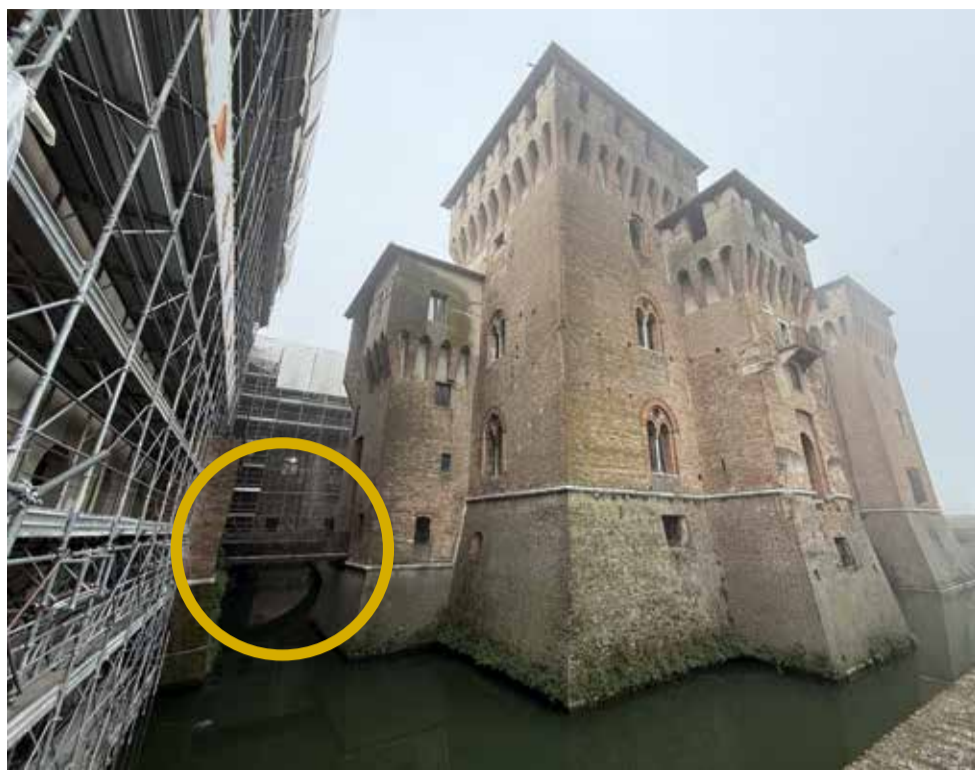
Una vista del piccolo ponte che collega Corte Nuova e il Castello di San Giorgio

Un'immagine della campagna social per Palazzo Ducale (Wegloo)