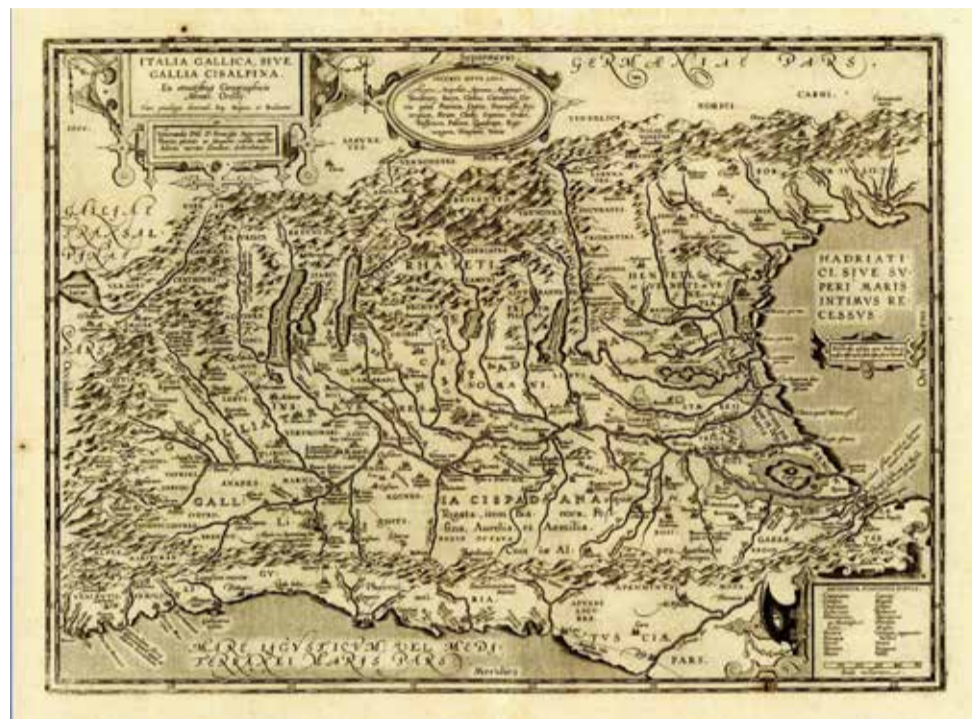
La Gallia Cispadana in un'antica stampa

Furono però i ritrovamenti di ambra, sulle quelle stesse imbarcazioni riportate alla luce tra il mantovano e il cremonese, a confermare l'interesse dei popoli meridionali dell'Europa per il commercio di questo materiale, che operavano utilizzando la via del Po e dei suoi affluenti fino a raggiungere il mare Adriatico. Non ci sarebbe nulla di strano, se non per il fatto che questa resina fossile è originaria del Mar Baltico, dove già era conosciuta e raccolta diecimila anni fa. Curiosa per gli insetti e i vegetali incastonati così come per le sue proprietà elettriche, l'ambra ha stupito gli archeologi per i suoi lunghi viaggi via acqua, arrivando fino all'Egitto, a Creta e Micene. Oggetti ornamentali di questo materiale, rinvenuti nelle necropoli di quelle zone e in quelle etrusche della Valle Padana, danno la certezza dell'esistenza di commerci tra l'Europa del sud e del nord ancor prima dell'invenzione della ruota. Naturalmente, non ci sono documenti che possano confermare queste ipotesi preistoriche ma